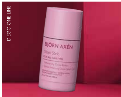
DIEGO ONE LINE