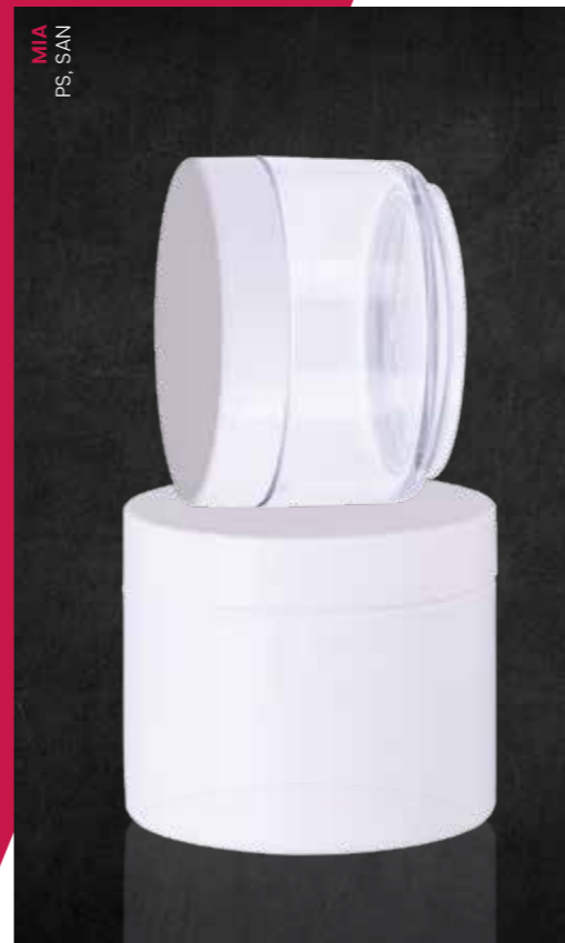
MIA PS, SAN