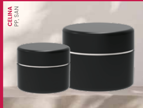
CELINA PP, SAN