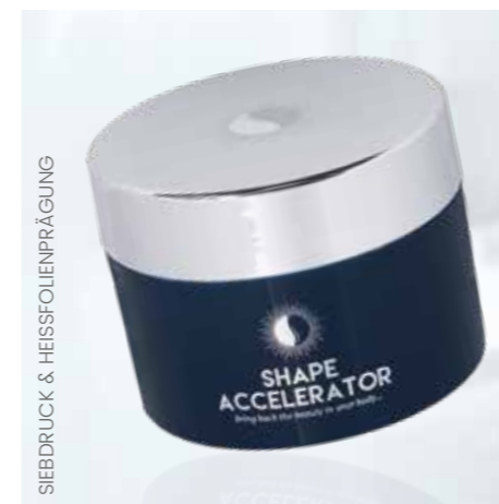
SIEBDRUCK & HEISSFOLIENPRÄGUNG