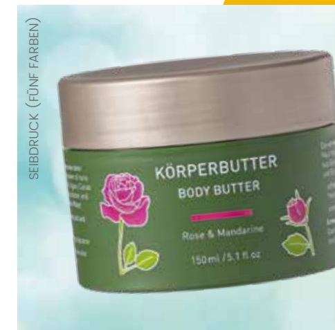
SIEBDRUCK (FÜNF FARBEN)