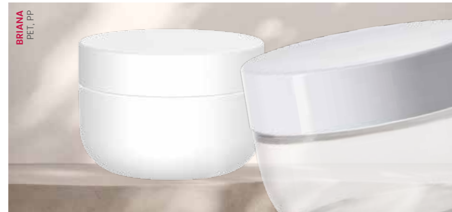
BRIANA PET, PP